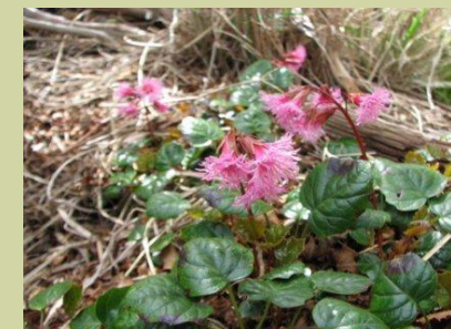
アカバナヒメイワカガミ