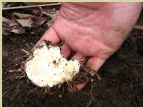
テンナンショウの食べあと

森の動物に出会ってみたい…でも、やっぱりクマとの出会いは、足跡くらいでドキドキがちょうどいいかもしれませんね！ (長縄)