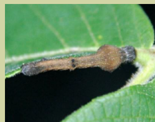
ヨツメエダシャク

例えば、フワフワしたやわらかな毛並みに美しい青の模様をした“クスサン”の幼虫や、涙を流しているような顔の模様をした“マイマイガ”の幼虫、ウサギの耳のように長い毛を持つ“ヒメシロモンドクガ”の幼虫。「これ??」というほど目立たず、枝のような“ヨツメエダシャク”の幼虫。その行動も面白く、シャクシャクと上から下へ葉を食べていく様子や“尺取り虫”の名の通り尺を取って歩く幼虫、足ではなくひっくり返って背中歩く幼虫（カナブン等の仲間）など、見れば見るほど発見があります。