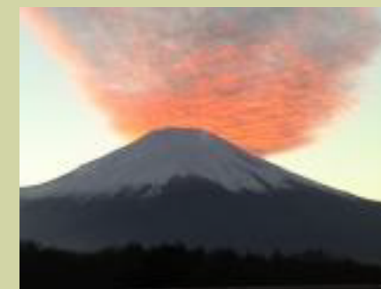
写真③：噴煙は成層圏まで達するような勢いである。大量の溶岩も流れ出す。

皆さんも是非、丹沢の展望の良い山に登った時には、富士山と雲を眺めて見て下さい。きっと素晴らしい情景に出会えるのではないのでしょうか？(大津)